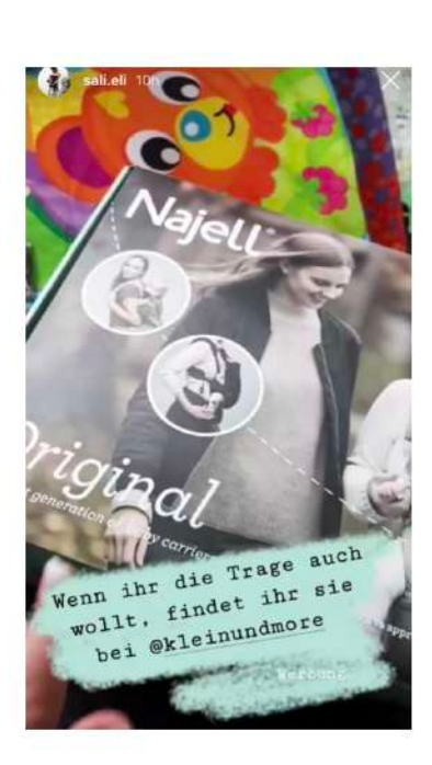
Najell, Instagram Story